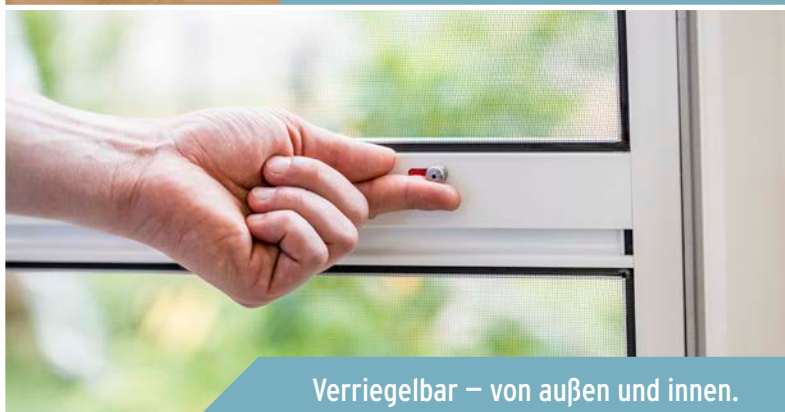
Verriegelbar – von außen und innen.