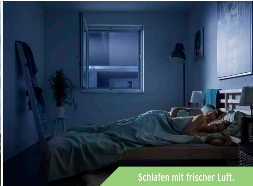
Schlafen mit frischer Luft.