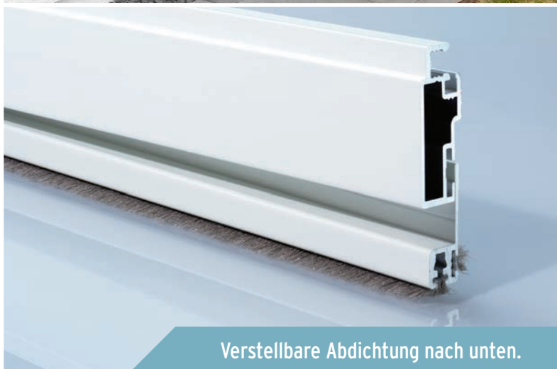
Verstellbare Abdichtung nach unten.