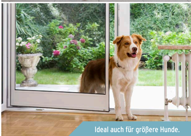
Ideal auch für größere Hunde.