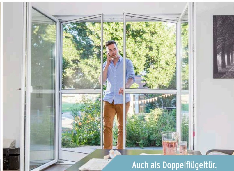
Auch als Doppelflügeltür.