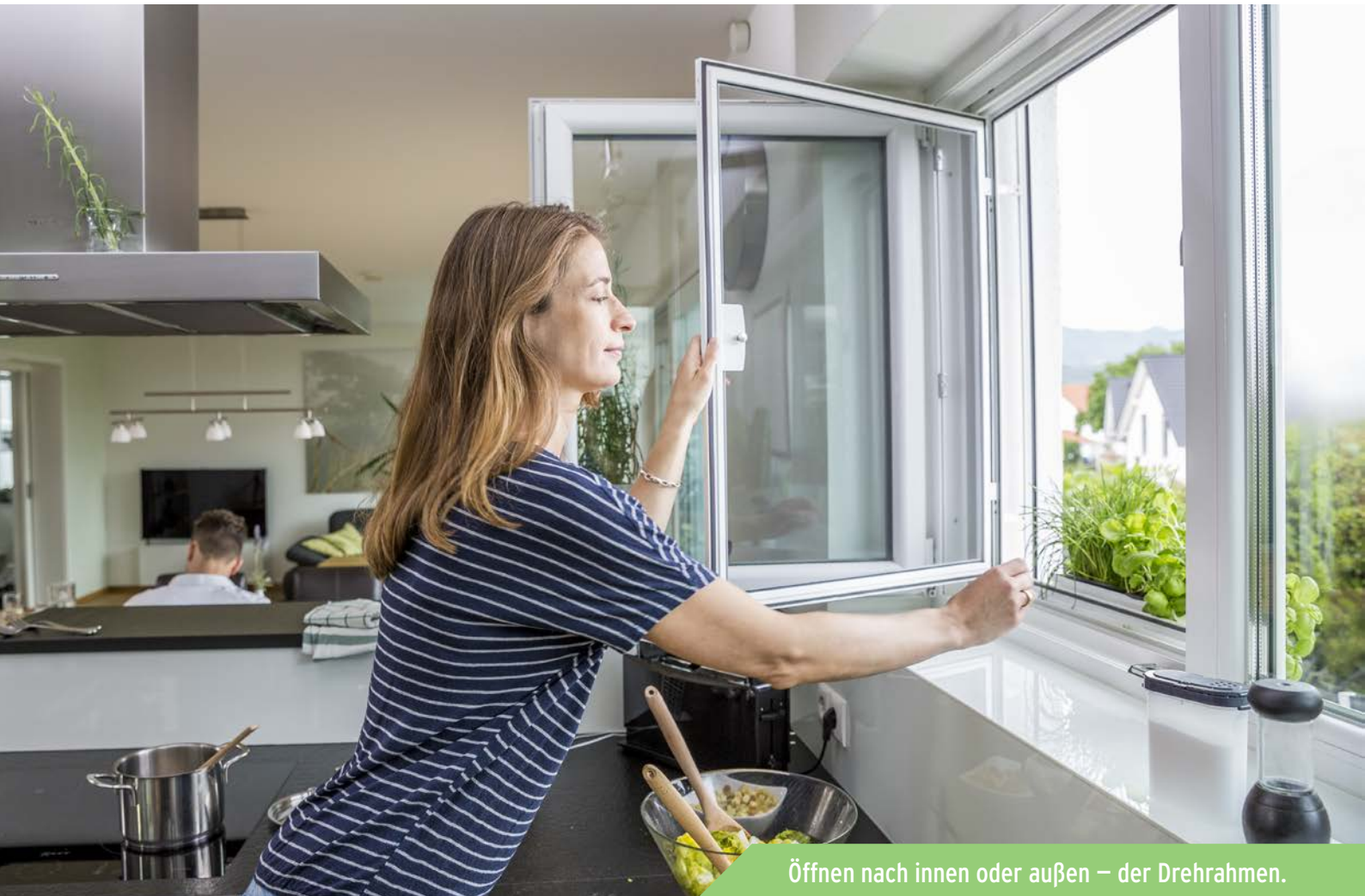
Öffnen nach innen oder außen – der Drehrahmen.

Wenn Sie Ihre Fenster häufig öffnen und schließen, beispielsweise zum Blumen gießen, sind Dreh- oder Pendelfenster als Insektenschutz die ideale Wahl. Sie sind einfach und schnell zu bedienen, robust, stabil und unauffällig. Die Scharniere und die ergonomischen Griffe sind aus Metall, damit sie auch nach jahrelangem Gebrauch noch zuverlässig funktionieren und optisch ansprechend bleiben.