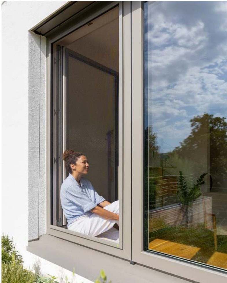
Maximaler Licht- und Luftdurchlass.

Unser mehrfach ausgezeichnetes und patentiertes Transpatec-Gewebe besticht durch maximalen Licht- und Luftdurchlass. Wir zeigen Ihnen gerne die Vorteile dieses Hightech-Produkts.