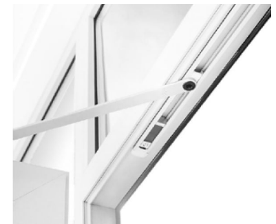
verdeckt liegende Variante