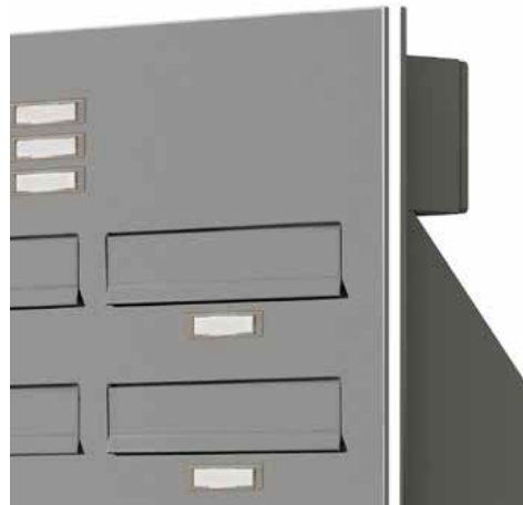
angeschrägter Kasten: steht weniger tief in den Raum hinein (300 mm anst. 385 mm)