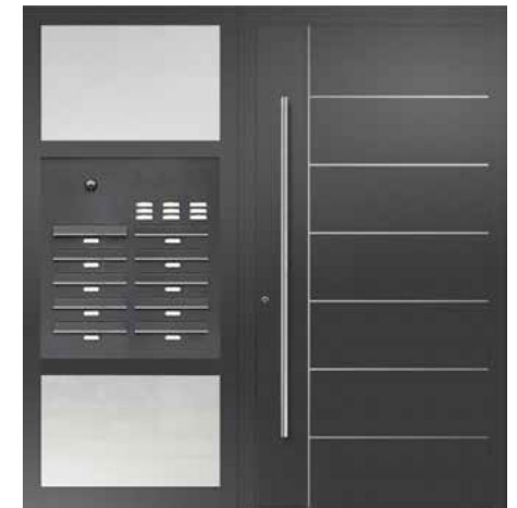
Türfüllung Metris geschlossen