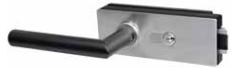
PZ-Lochung Variante mit Drücker in schwarz matt C35