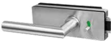
Badezimmer / WC