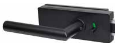
Badezimmer / WC