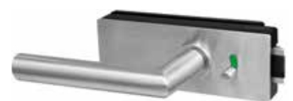
Badezimmer / WC